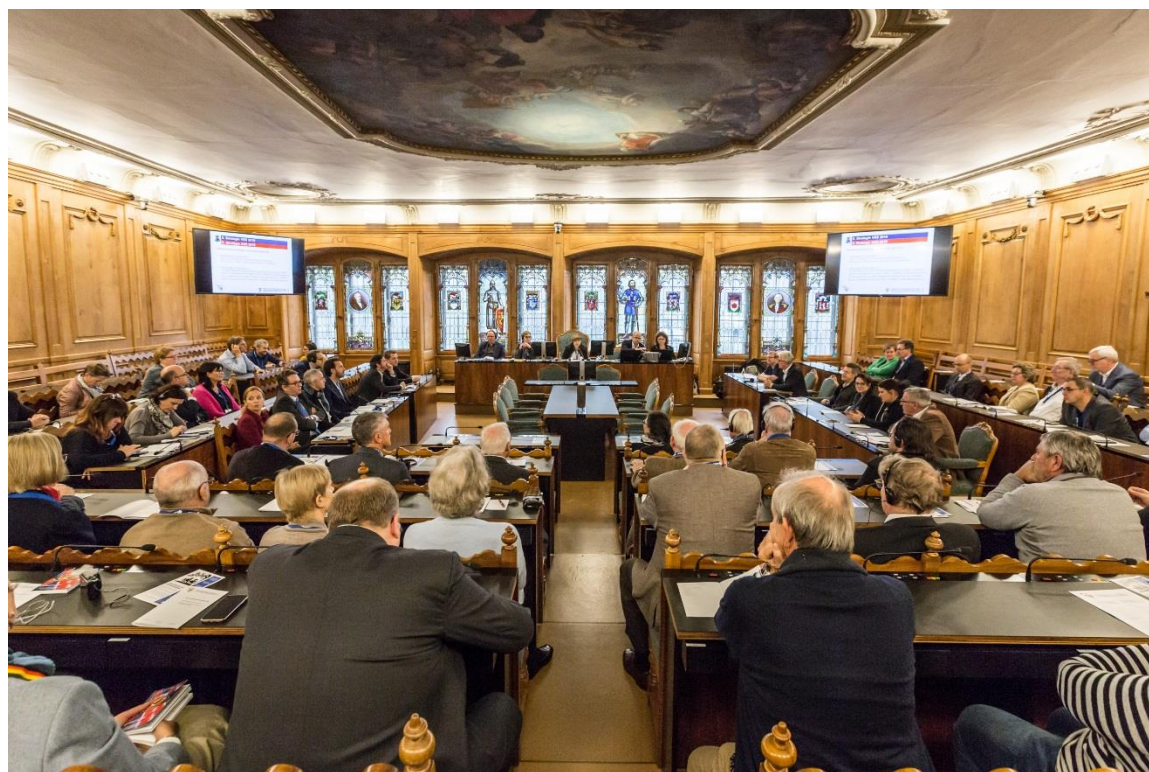
40. GV in Fribourg